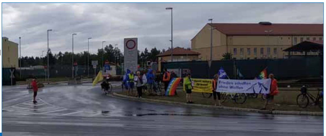
Bild unten: Die Friedensfahrradtour der DFG-VK Bayern vor der Zufahrt zum Truppenübungsplatz Grafenwöhr, August 2019

Ausführlich im Artikel in der Lausitzer Rundschau v. Sept. 2019: https://www.lr-online.de/nachrichten/polen/blick-nach-polen-us-panzerstuetzpunkt-zagan-weiter-in-der-schwebe-39312465.html