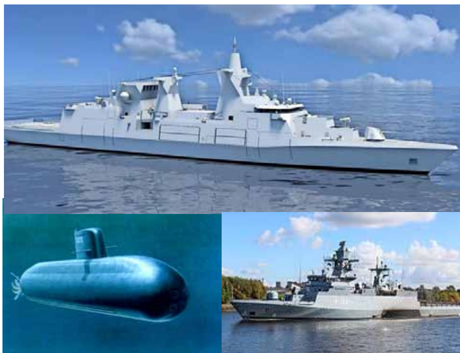
Die deutsche Marine strebt nach einer Führungsrolle bei der künftigen Kriegführung in der Ostsee