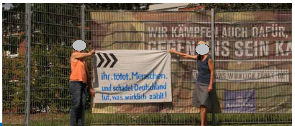
Bild unten: Die Friedensfahrradtour am Logistikzentrum der NATO in Ulm

Anschauliche Infos zum Manöver: http://www.frieden-und-zukunft.de/userfiles/pdf/2020/2020-01_Defender.pdf