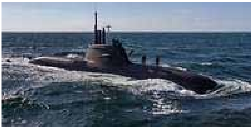
U 34 in der Ostsee bei der multinationalen NATO-Übung „Northern Coasts“

Mehrzweckkampfschiffe (MKS 180), auch als „Langstreckenregatten“ bezeichnet. 4 Stück für 5,3 Milliarden Euro. „Das kostspieligste Projekt der Deutschen Marine seit 1945“