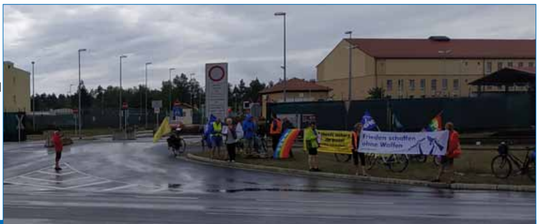
Bild unten: Die Friedensfahrradtour der DFG-VK Bayern vor der Zufahrt zum Truppenübungsplatz Grafenwöhr, August 2019

Ausführlich im Artikel in der Lausitzer Rundschau v. Sept. 2019: https://www.lr-online.de/nachrichten/polen/blick-nach-polen-us-panzerstuetzpunkt-zagan-weiter-in-der-schwebe-39312465.html