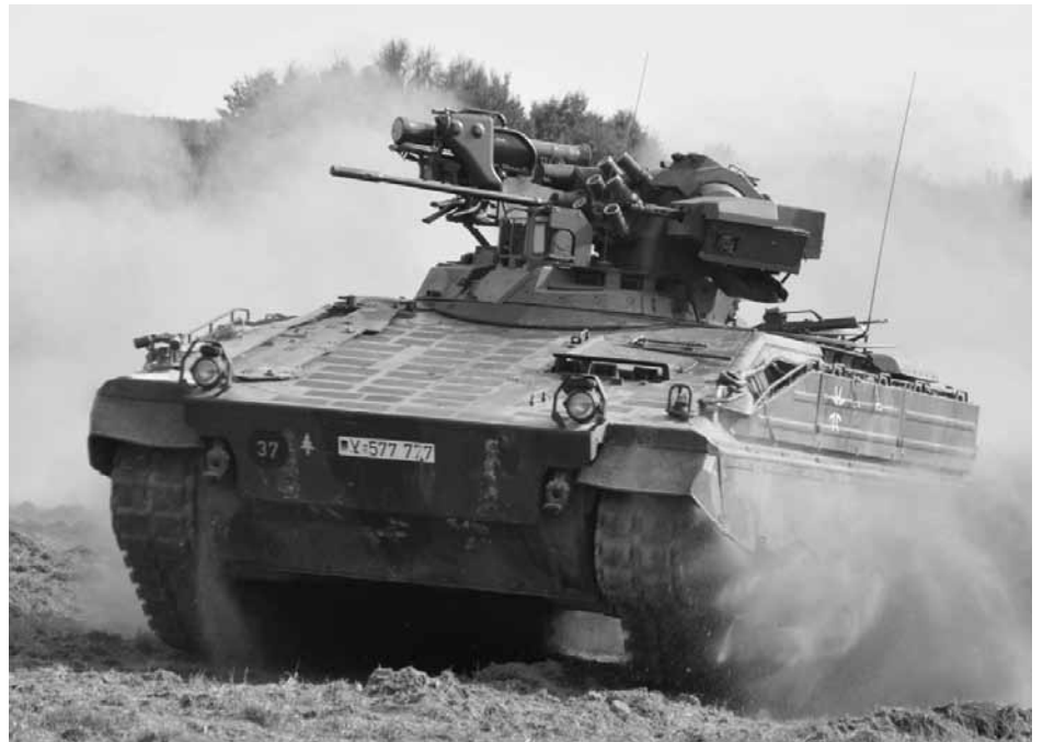
Hochgradig klimaschädlich: Bundeswehrpanzer vom Typ Marder

Kritisch zu sehen ist hier vor allem der Treibstoffverbrauch. Alleine das US-Militär benötigte im Jahr