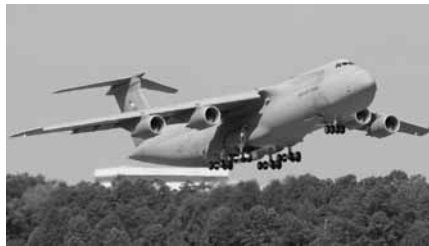
Schluckt Unmengen Treibstoff: US-Militärtransporter „Galaxy“

hausgas-Bilanzen nicht berücksichtigt werden. Diese Ausnahmeregelung wurde beibehalten, obwohl die USA das Kyoto-Protokoll letztlich nicht ratifiziert haben. Mit der Klimakrise ist eine zusätzliche Aufgabe auf die Friedensbewegung zugekommen: Sie muss die Rolle der Militärs als wichtige Mitverursacher des Klimawandels thematisieren und dabei den Schulterschluss mit der Klimaschutzbewegung suchen.